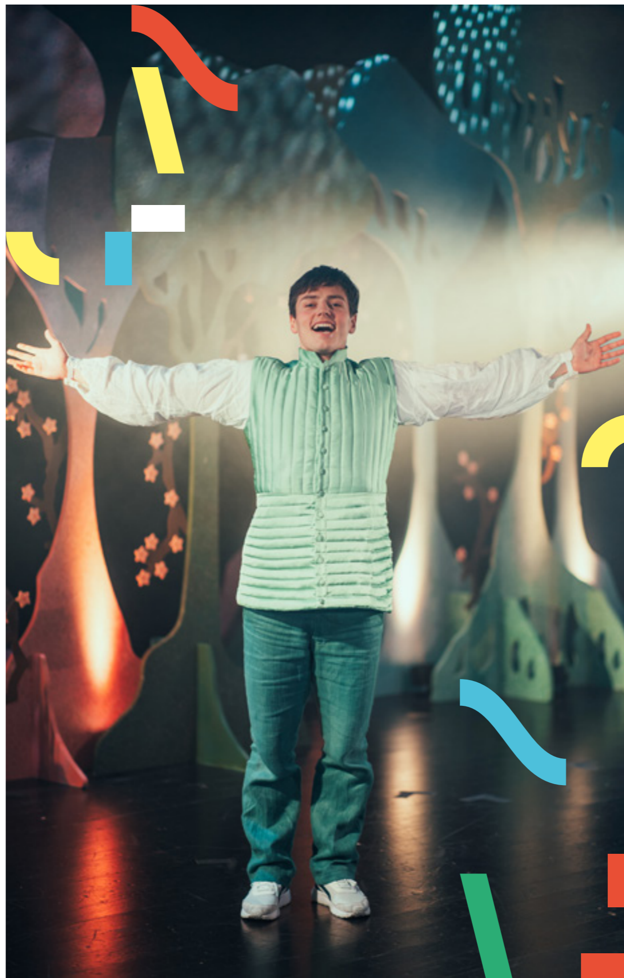
Brødrene Løvehjerte