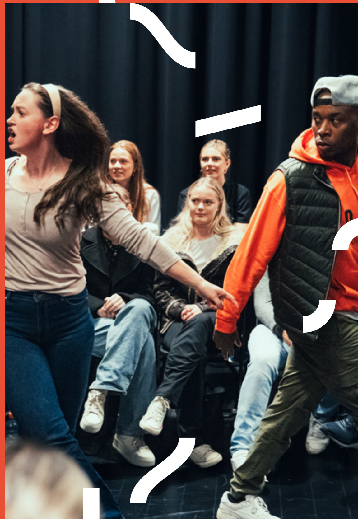
Parallele virkeligheter

Vi har i 2023 hatt god dialog med de ansvarlige for DKS i nye Buskerud. Det legges til rette for en mest mulig sømløs overgang tilbake til det samarbeidet som er godt etablert mellom Brageteatret og Buskerud fylke. Teatret vurderes som en langsiktig partner og leverandør av scenekunst i fylket, noe som er avgjørende for vår planlegging og strategiske vurderinger. Dette samarbeidet har fungert svært godt i mange år, og danner et stabilt grunnlag for kontinuitet, forutsigbarhet og kvalitet for fylkets grunnskoleelever.