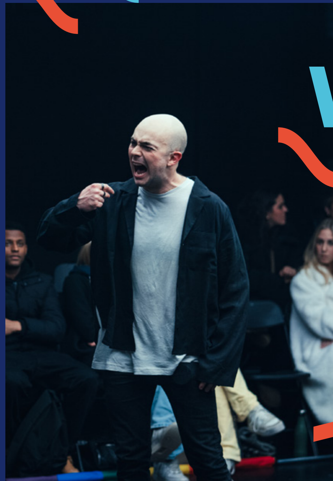
Stor Cis-energi

Brageteatret utviklet en rekke hørespill og lyddrama under korona, som for eksempel Bilde av en Brennende Tesla og Jørgen Moes vei. I 2023 har vi forsøkt å videreføre arbeidet med digital formidling, spesielt rettet inn mot skoleturné. Med en egen instruksjonsfilm for dansen i «Bortenfor Stjernene» på våren, så vi at det ble godt tatt imot på skoler og ble godt brukt. Derfor laget vi en serie instruksjonsfilmer for «Eldorado» som turnerte i DKS våren 2023. Vi håper og tror vi at vi kan høste nye erfaringer om innhold og bruk, og at dette er et tilbud som gir en meropplevelse for elevene som ser forestillingen. Som nevnt har vi også fått skrevet og spilt inn et nytt lyddrama – Darlings - for ungdom som ble lansert i mars 2023. Disse digitale plattformene gir oss muligheten til å holde kontakten med en relativt vanskelig tilgjengelig målgruppe i periodene mellom forestillinger. Vi tror at det er et større potensiale i dette arbeidet, men det er i stor grad et spørsmål om ressurser både økonomisk og bemanningsmessig.