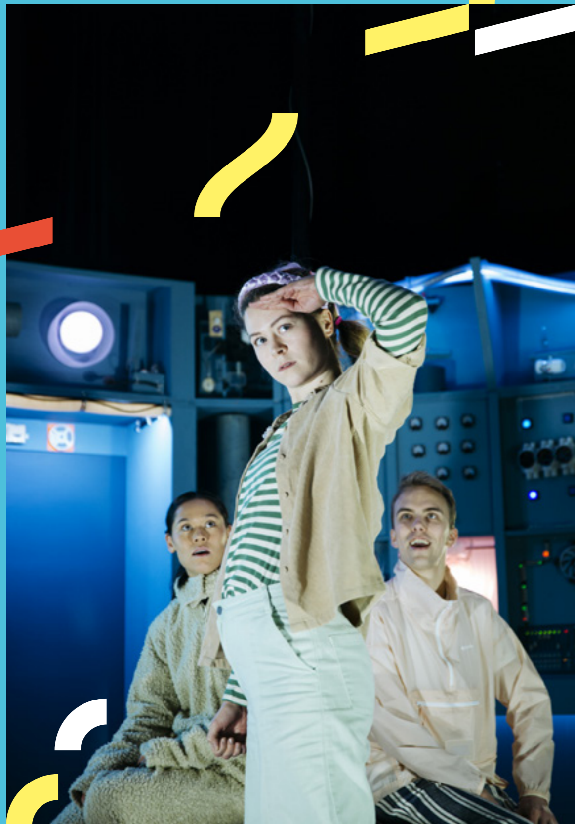
Bortenfor stjernene