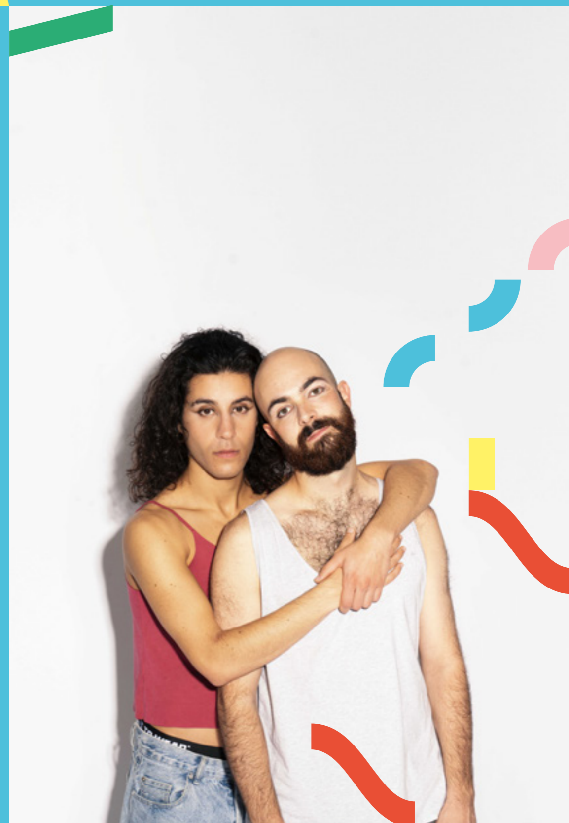
Stor Cis-energi