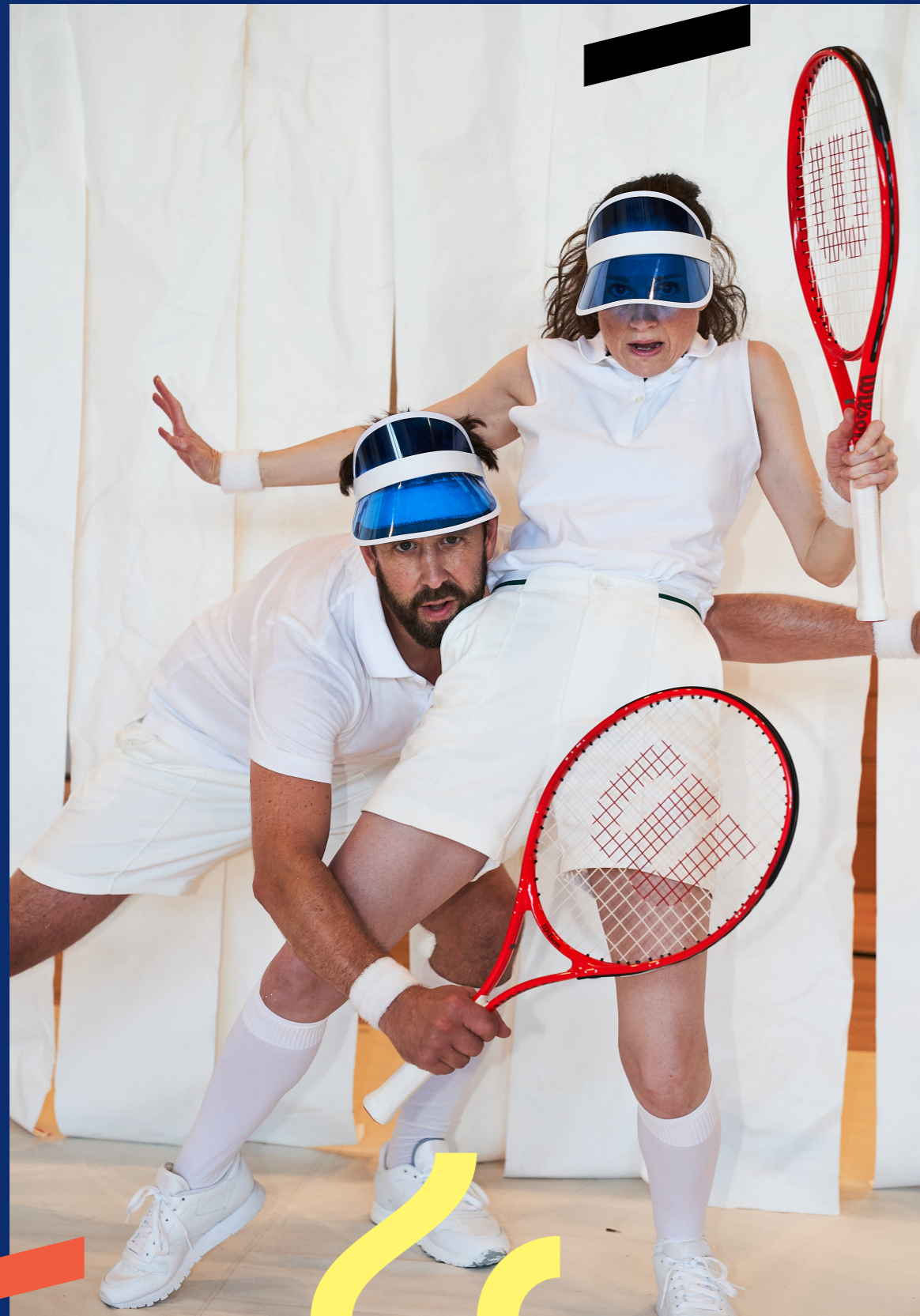
Framtidens gym