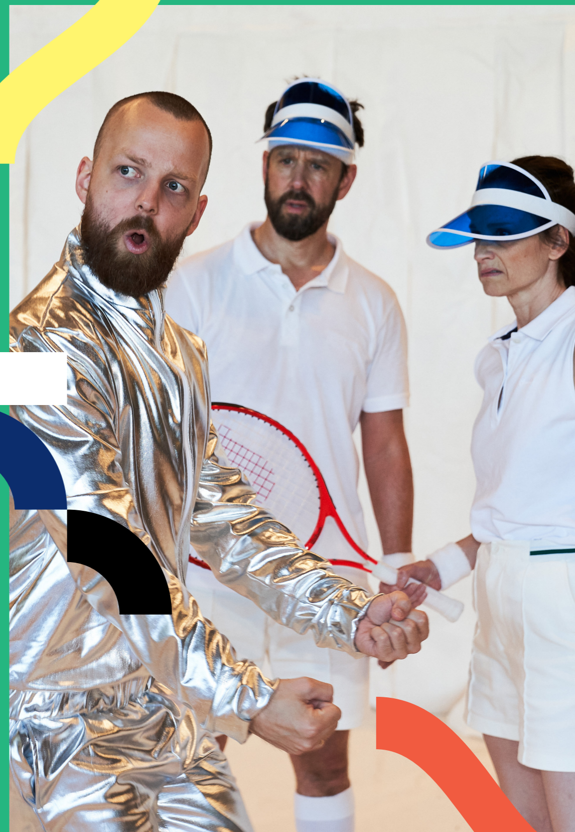
Framtidens gym