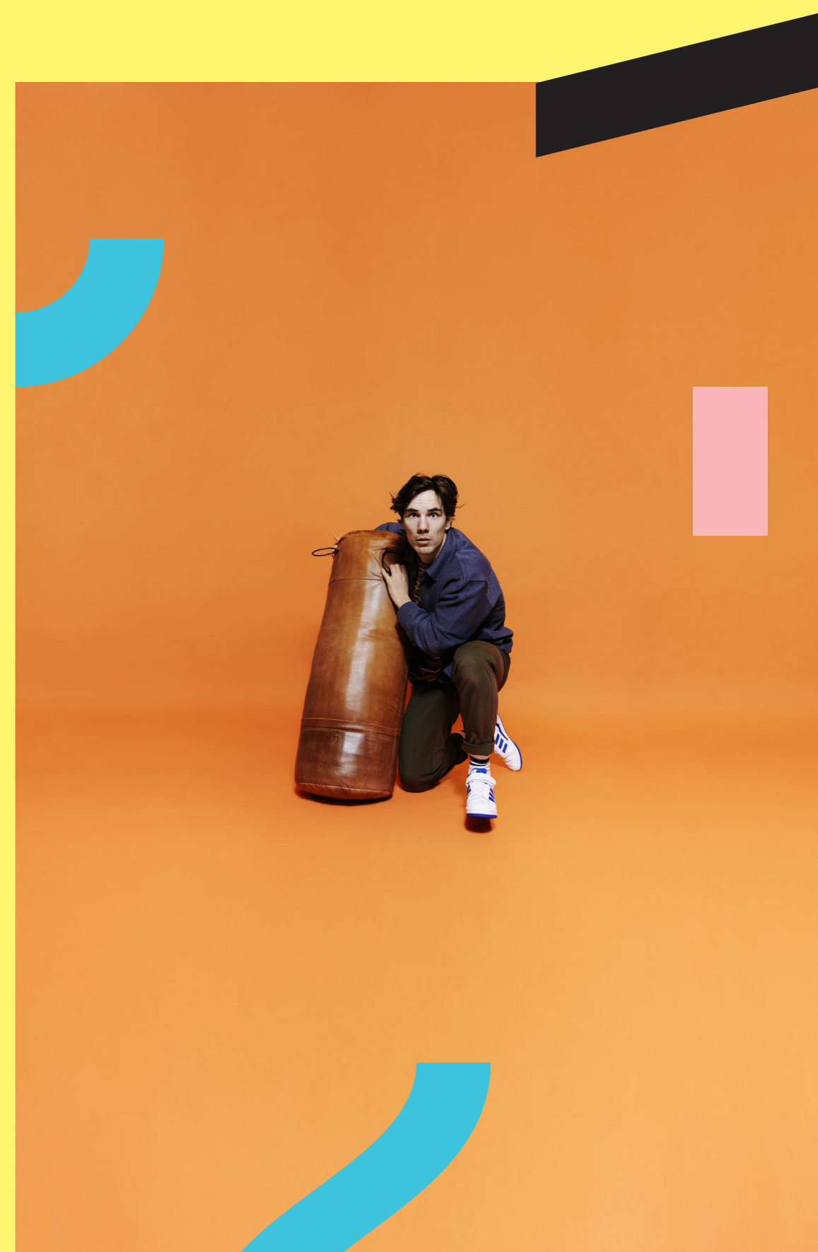
Patrick's triks

Vi ønsker å beholde ansvar for så mye som mulig av i den nye Buskerud fylkeskommune, slik at vi kan fortsette den gode ressursutnyttelsen som har kommet så mange barn og unge til gode. Det er fra vårt ståsted viktig at nye Buskerud DKS også i fremtiden sørger for forutsigbare og langsiktige avtaler slik at tilbudet Brageteatret kan gi i regionen, ikke svekkes.