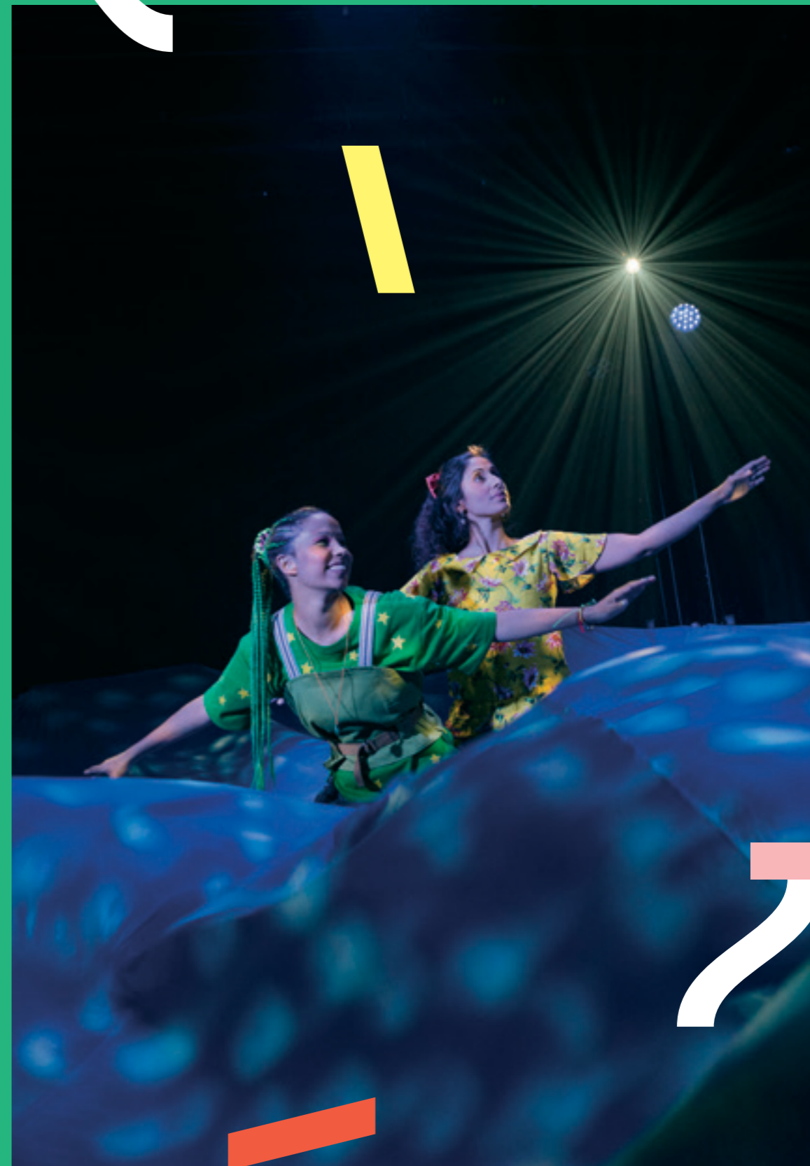
Peter Pan

Brageteatrets virksomhet medfører ingen forurensning av det ytre miljø.