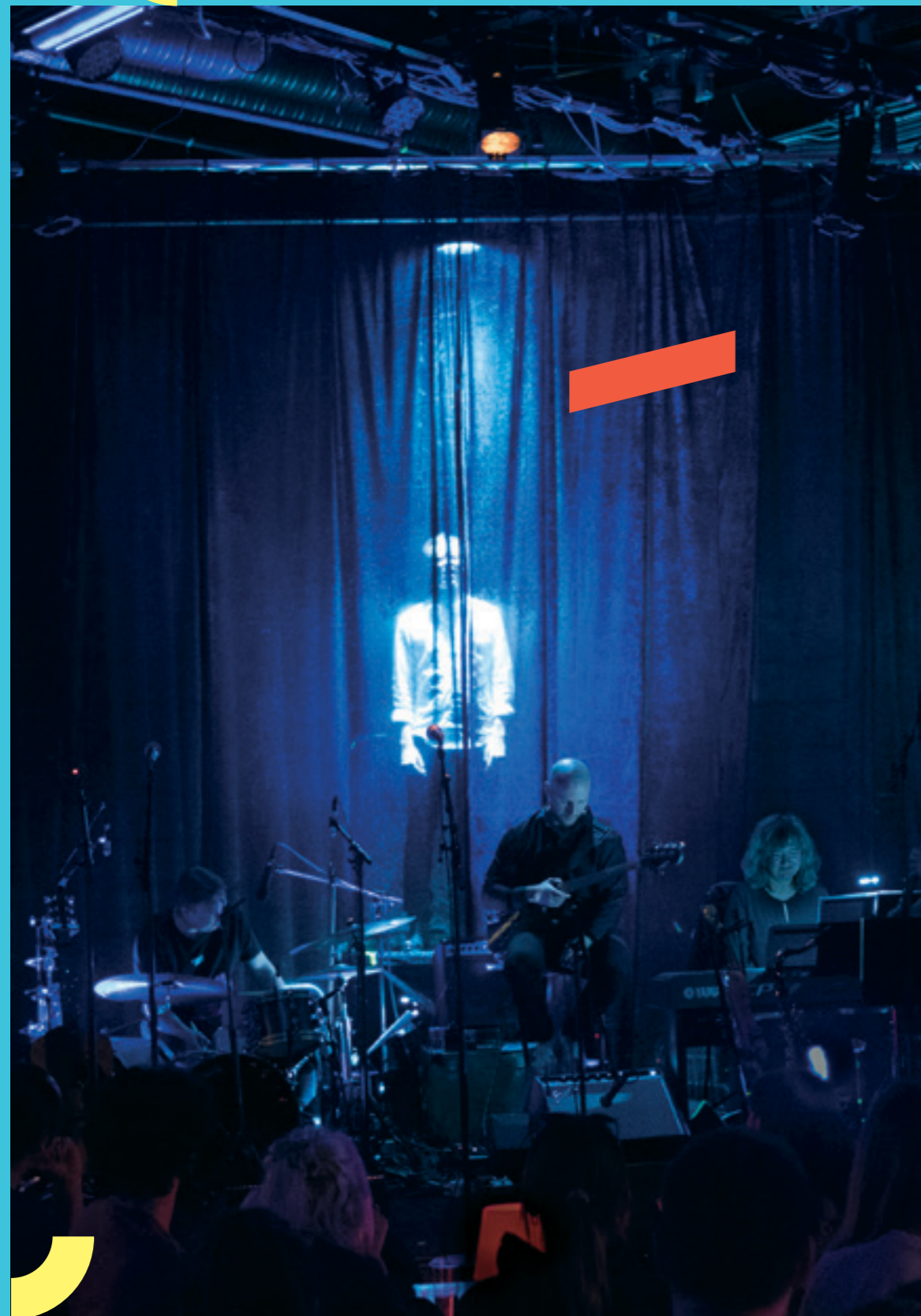
Sett bagen fra deg