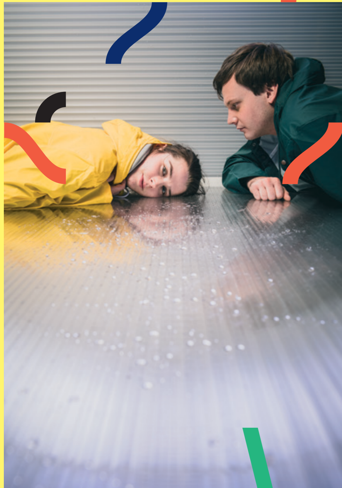
Nå er du Gud igjen