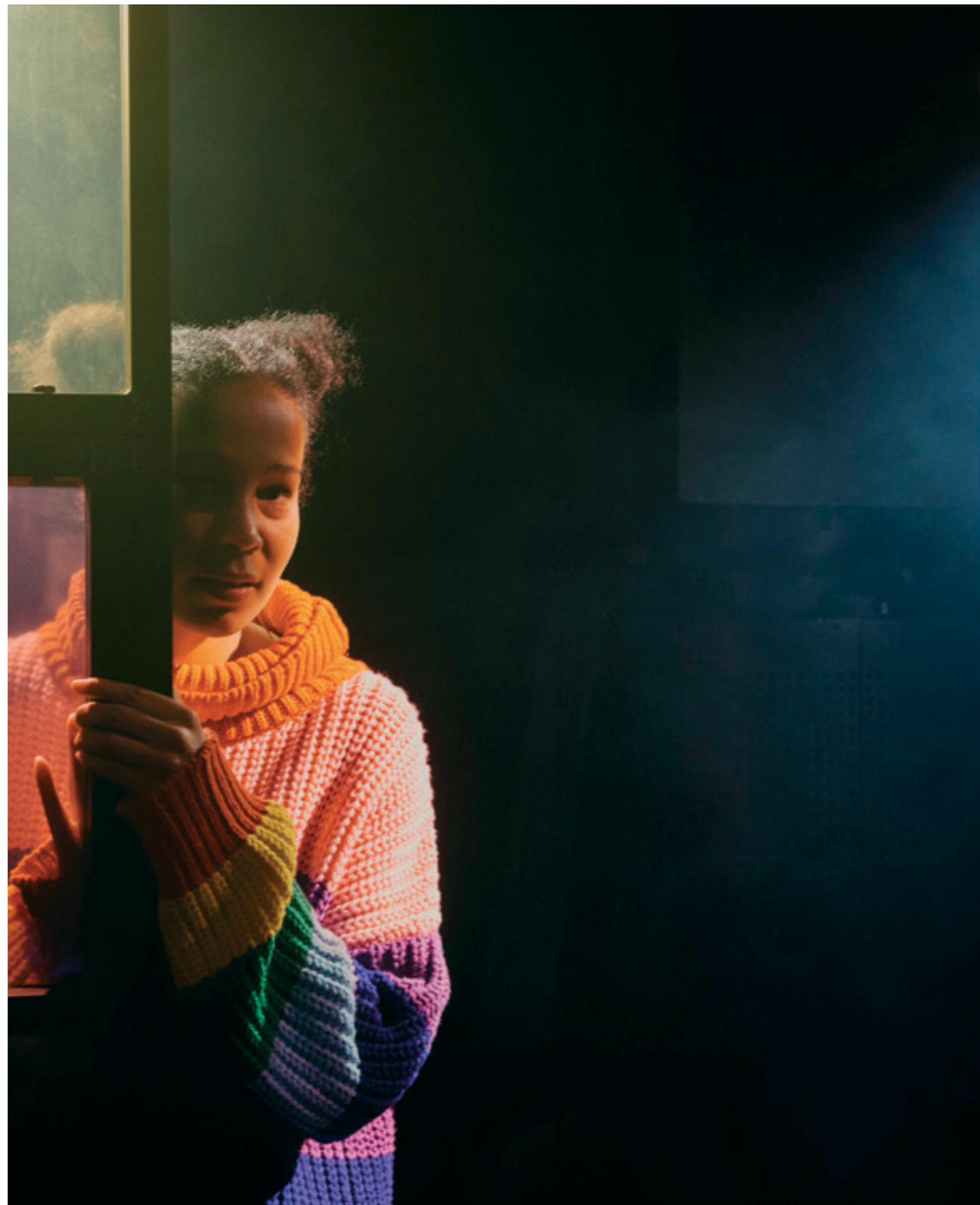
Indigo Englehår

Mens vi går fremover i denne prosessen gjennomfører vi årlig vedlikehold og oppgradering for å imøtekomme kravene til funksjonalitet, helse, miljø og sikkerhet for ansatte og publikum.