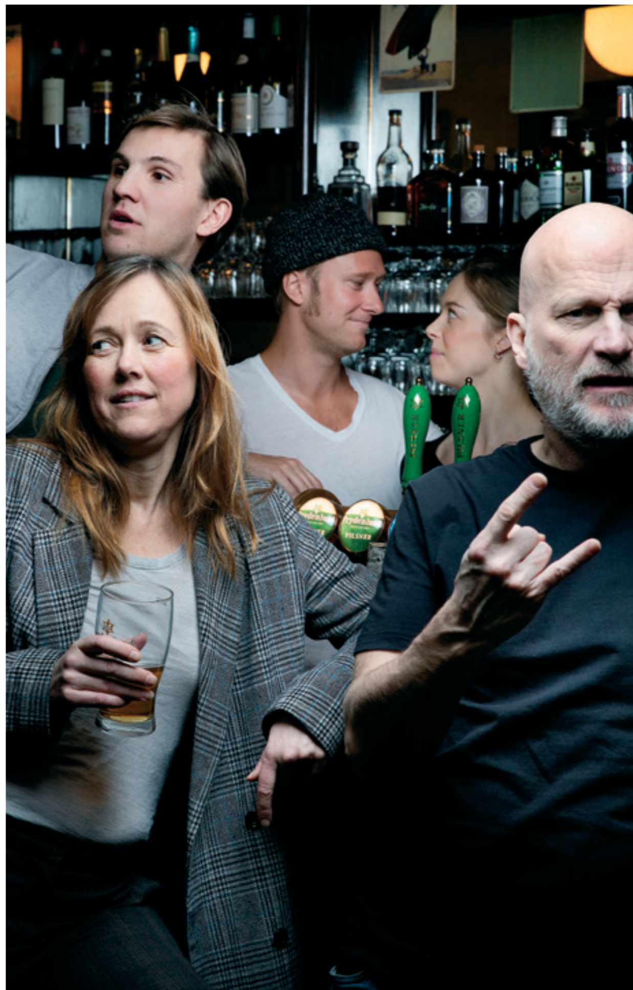
Sett bagen fra deg