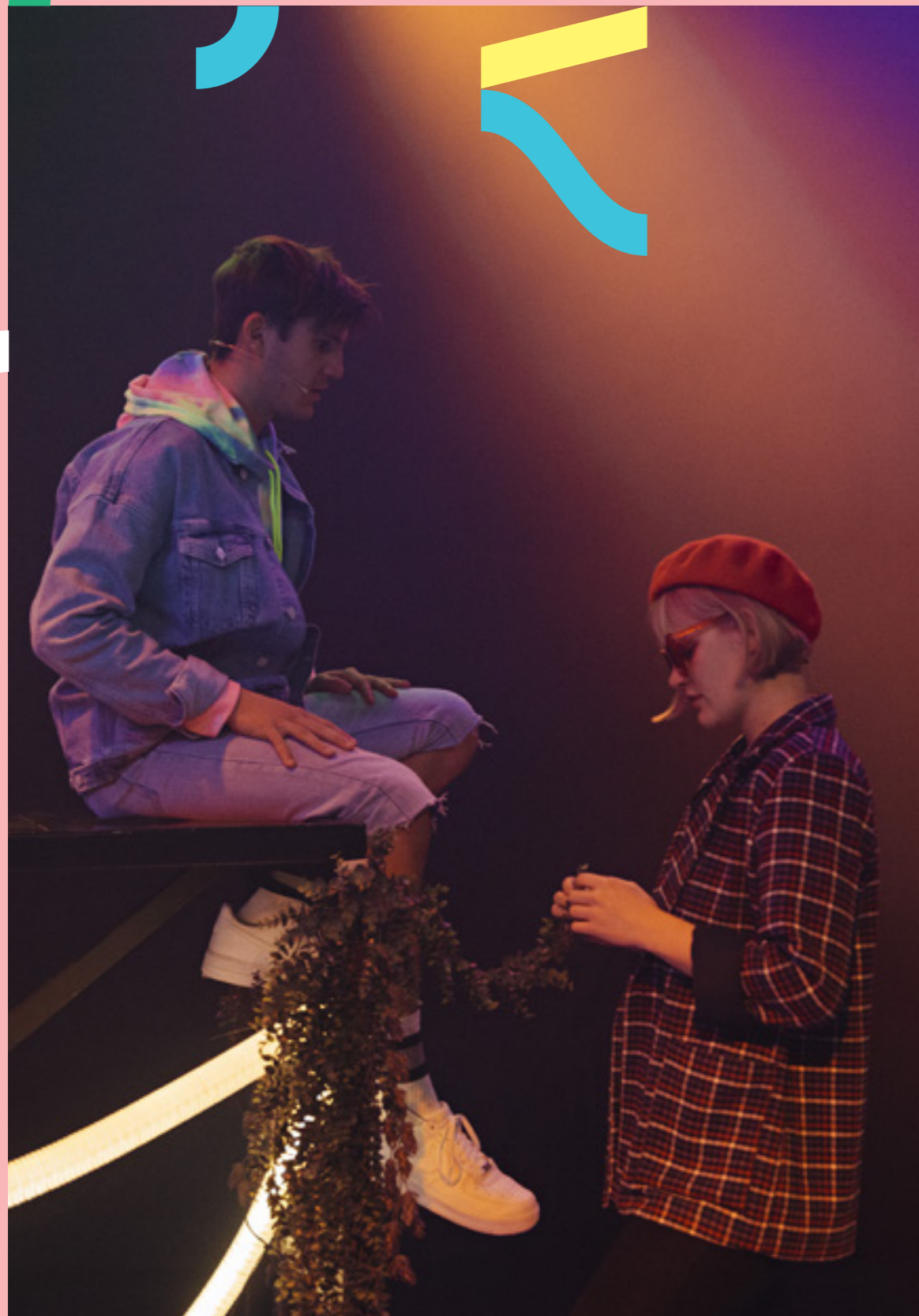
Indigo Englehår

Til generalforsamlingen i Brageteatret - regionteater for Buskerud AS