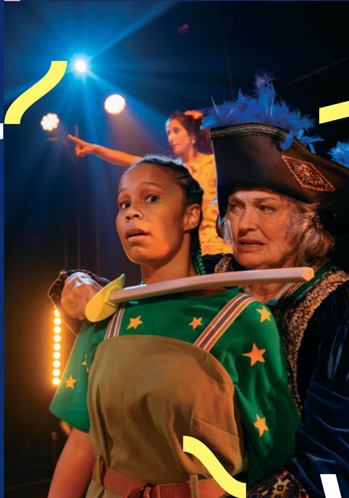
Peter Pan