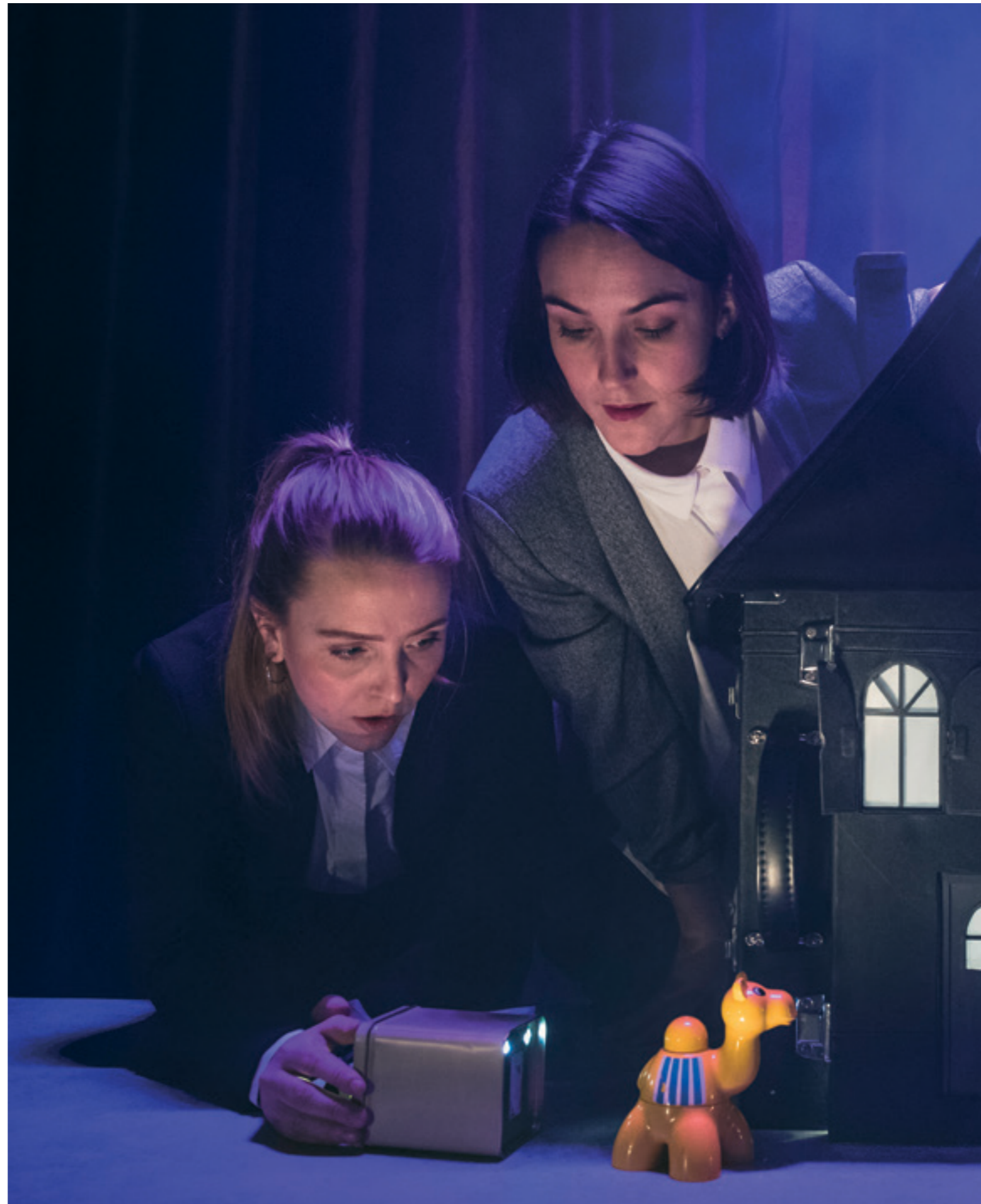
Jørgen Moes vei nr 13

I samproduksjon med Kongsberg Jazzfestival laget vi en konsertforestilling som blandet materiale fra de to kunstnerne med «remiksing» som overordnet tema. Både Hannes sanger og Fredriks tekster ble vendt og bearbeidet på nye måter i møte med nytt materiale fra dem begge. Produksjonen fikk meget god mottagelse og ble omtalt som årets festivaløyeblikk i pressen.