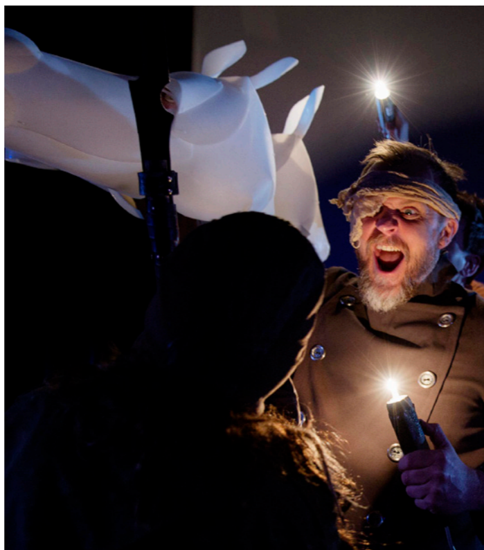
Brødrene Lovehjerte

KAMUFLASJE! er et stykke om det å være fryktelig redd, og tar publikum inn i dette temaet gjennom spektakulære figurer, lys og bevegelig scenografi. Forestillingen er utarbeidet av Cecilie Solberg Knudsrød i Krutt og Kamfer i samarbeid med Brageteatret. Den ble delvis produsert i Brageteatrets lokaler med premiere og forestillinger for Drammensskolene, 5. – 7. klassetrinn høsten 2016. KAMUFLASJE turnerte i flere kommuner i Buskerud også i vårhalvåret 2017.