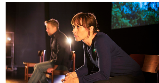
Historie om et ekteskap