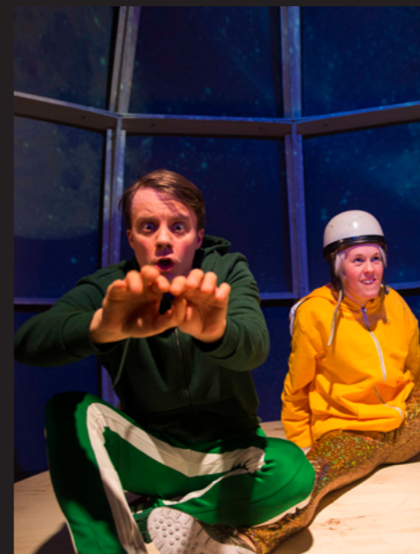
Satelitter på himmelen