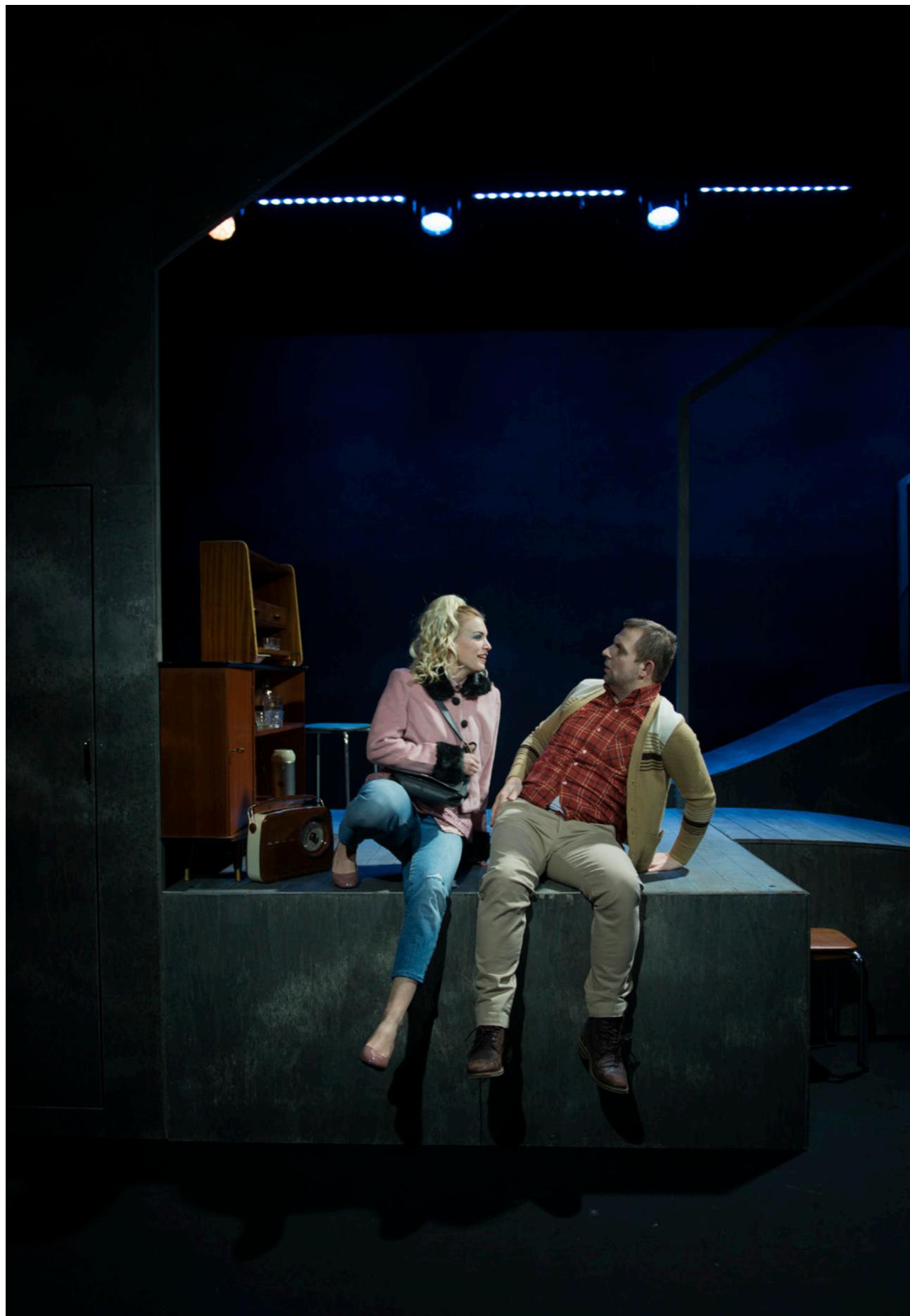
Det er her vi kommer fra