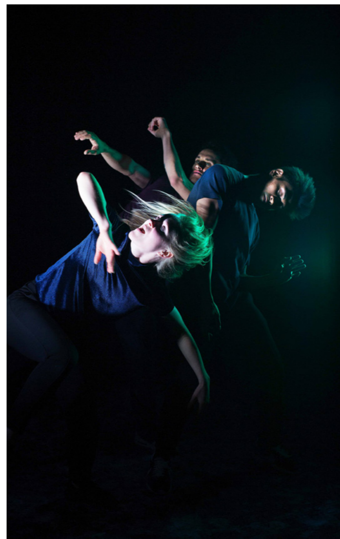
Make Me Dance

Teatret var uten kunstnerisk leder i perioden.