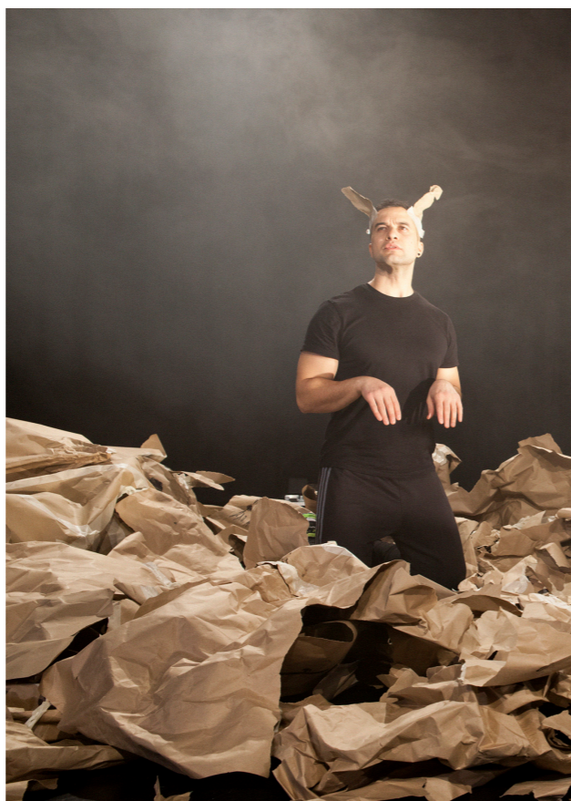
Over: Romeo og Julie