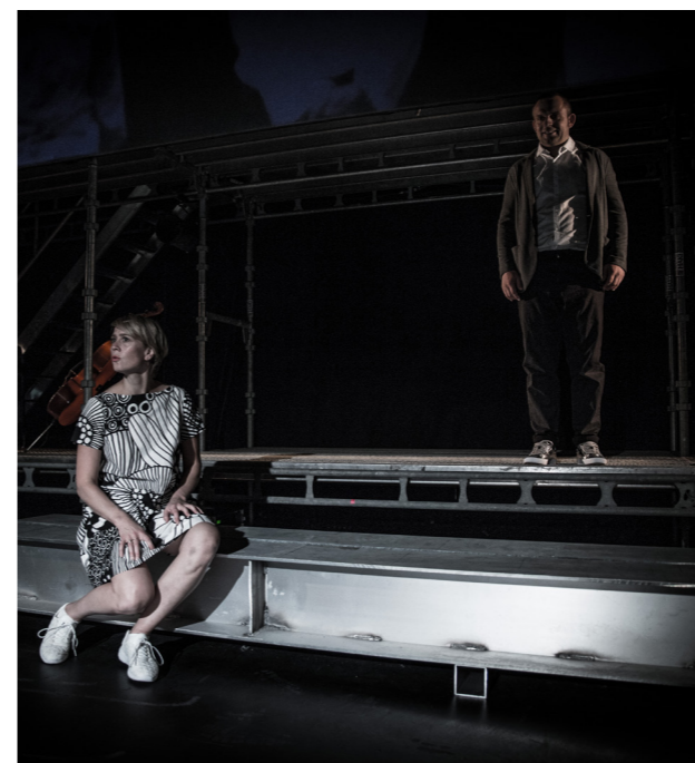
Over: Dracula